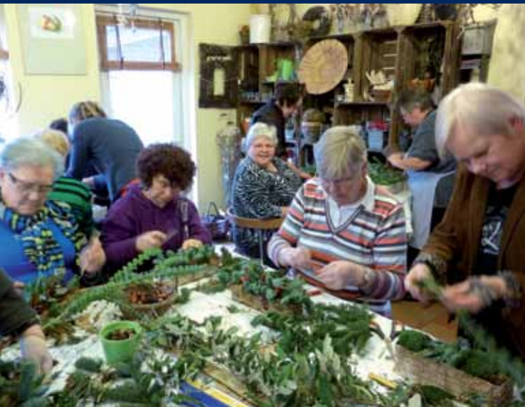
Samen aan een ontspannen activiteit deelnemen, geeft je weer nieuwe energie.

Op zondag 10 november 2013 vindt de Dag van de Mantelzorg plaats. Dit jaar wordt deze bijzondere dag voor de zestiende keer gevierd. Verschillende Steunpunten Mantelzorg organiseren rondom deze datum diverse activiteiten voor mantelzorgers. Kijk op de website of jouw Steunpunt iets leuks organiseert.